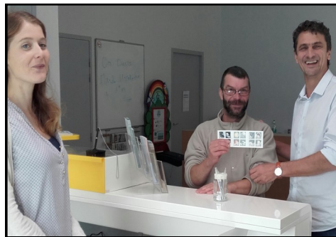
Geste symbolique – un carnet de timbres à été remis au premier usager de la nouvelle agence postale.

Des négociations avec La Poste, la ville, le collectif et l'association sont engagées pour réfléchir à une organisation qui prend en compte les adaptations liées aux évolutions technologiques et qui sauvegarde le service postal de proximité. C'est à partir d'une Agence Postale Communale que peut se